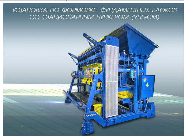
УСТАНОВКА ПО ФОРМОВКЕ ФУНДАМЕНТНЫХ БЛОКОВ СО СТАЦИОНАРНЫМ БУНКЕРОМ (УПБ-СМ)

Срок гарантии: до 18 месяцев с момента отгрузки оборудования.