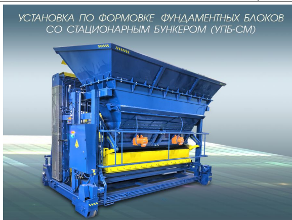
УСТАНОВКА ПО ФОРМОВКЕ ФУНДАМЕНТНЫХ БЛОКОВ СО СТАЦИОНАРНЫМ БУНКЕРОМ (УПБ-СМ)