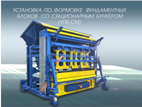
УСТАНОВКА ПО ФОРМОВКЕ ФУНДАМЕНТНЫХ БЛОКОВ СО СТАЦИОНАРНЫМ БУНКЕРОМ (УПБ-СМ)